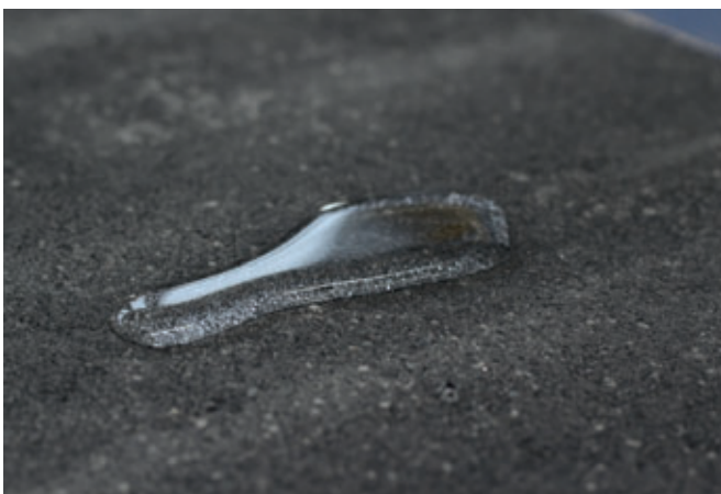
Die auf der Masa Anlage produzierten Betonwaren haben eine hochdichte Oberflächenstruktur.

Ein Umsetzer am Ende der Transportbahn nimmt die umreiften Steinpakete auf und setzt diese auf eine im 90 ° Winkel angeordnete Pakettransportbahn, die die Steinpakete in den Außenbereich befördert. Diese können mittels Gabelstapler in das Außenlager gefahren werden. Die letzte Transportbahn ist fast 24 m lang und bietet so im Außenbereich eine ausreichende