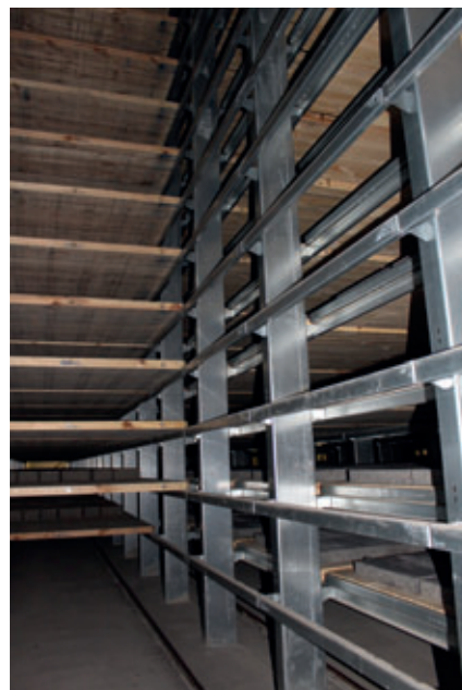
Die Gesamtkapazität der Aushärteanlage beträgt 7.392 Bretter

Die Bretter werden vor dem Einschub in die Betonsteinmaschine in der Ölsprühstation mit Trennöl eingesprüht und sind so für die Produktion vorbereitet.