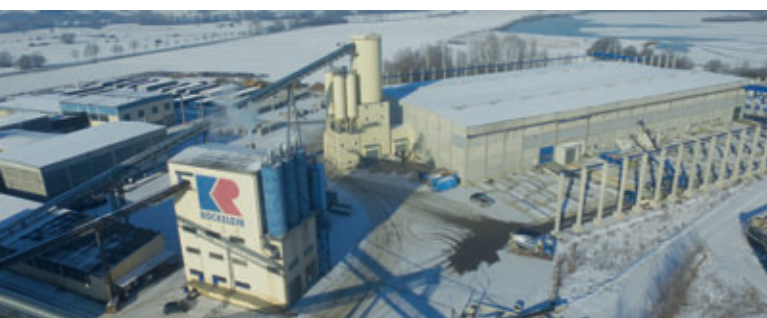
Der Röckelein Standort in Rattelsdorf mit der 2012 erbauten zweischiffigen Produktionshalle aus der Vogelperspektive

Für die neue Betonsteinproduktion wurde der Mischturm mit zwei weiteren Liebherr-Ringtellermischern bestückt. Der RIM 1.5-D (Nenninhalt 1,5 m 3 ) mit mechanischem