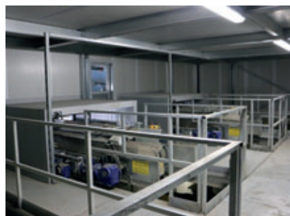
Schallschutzkabine mit Galerie