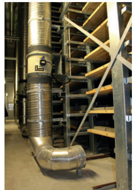
Das Rotho Umluftsystem schafft ein gleichmäßiges Klima.

Die Gesamtkapazität der Aushärteanlage beträgt 7.392 Bretter und ist als Großraumklimakammer inkl. Schiebebühnenbereich isoliert. Die Wärme und Feuchte der Steine aus dem Hydratationsprozess werden ge-