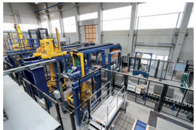
Blick auf die Trockenseite