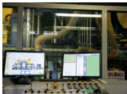
Neben der Betonsteinmaschine ist der Bedienstand installiert. Eine große Scheibe erlaubt den Blick auf die Betonsteinmaschine.

Moderne Technik und die bewährte Mischanlagensteuerung Litronic-MPS III von Liebherr sorgen für eine reibungslose Produktion von hochwertigen Betonen. Um auch bei niedrigen Temperaturen einen reibungslosen Betrieb sicherzustellen, wurde die gesamte Anlage mit blechummantelten Isolierelementen verkleidet und mit einem Heizsystem von Sauter ausgestattet. Zudem wurde in den Mischturms Betomat IV-685 eine Abluffilteranlage und eine Restbeton-Recyclinganlage integriert.