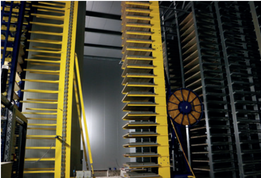
Schiebebühne und Puffergabelwagen

nutzt und das Rotho Umluftsystem schafft ein gleichmäßiges Klima. Die Umluftanlage ist modular aufgebaut und kann, falls gewünscht, später mit einem Rotho ProCure System (Beheizung und Befeuchtung) erweitert werden.