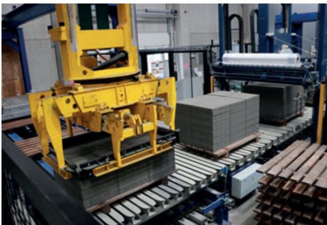
Masa Cuboter: Die komplett servogesteuerte Paketierung nimmt die Steinlagen von verschiedenen Abnahmepositionen und setzt sie zu einem Paket auf der Transportbahn zusammen.