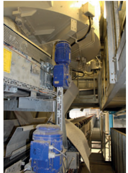
Der Liebherr Mischer RIH 0.5 ist für die Produktion des Vorsatzbetons im Einsatz; die Abgabe erfolgt auf ein Förderband