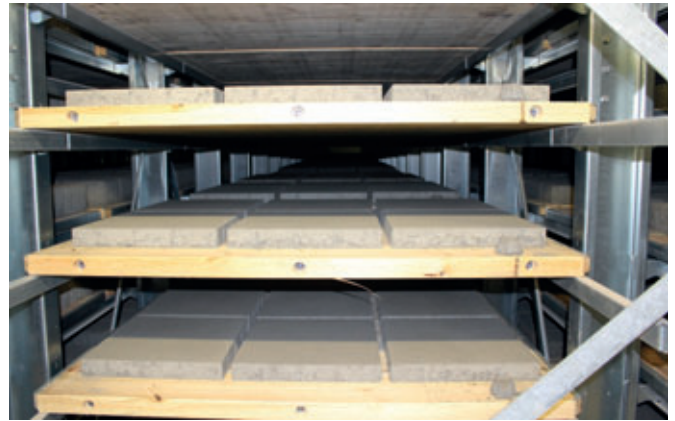
Das Aushärteregale wurde als Großraumklimakammer ausgeführt

zung auf unter 80 dB(A) erreicht. Die lichte Kabinenhöhe liegt bei 7.500 mm und trägt durch die große Absorptionsfläche ebenfalls zur besseren Schalldämmung bei.