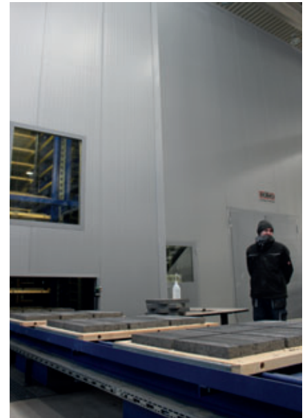
Die Bretter werden von der Senkleiter einzeln auf den Freihubförderer der Trockenseite gegeben.

Die komplett servogesteuerte Paketierung nimmt die Steinlagen von verschiedenen