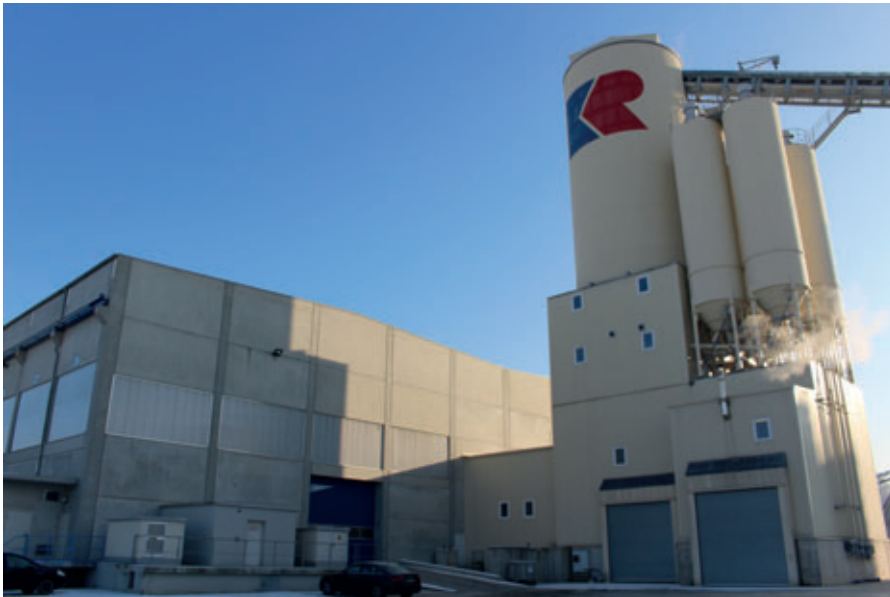
Der Liebherr Mischturms versorgt die Elementdeckenfertigung und die neue Betonsteinfertigungsanlage mit Beton.