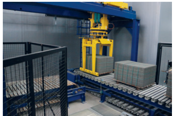
Ein weiterer Masa Umsetzer nimmt die unreifen Steinpakete auf und setzt diese auf eine im 90 ° Winkel angeordnete Pakettransportbahn.

Pufferzone für den Abtransport, sodass der Produktionsablauf innen nicht unterbrochen wird, sollte der Gabelstapler im Lager benutzt werden.