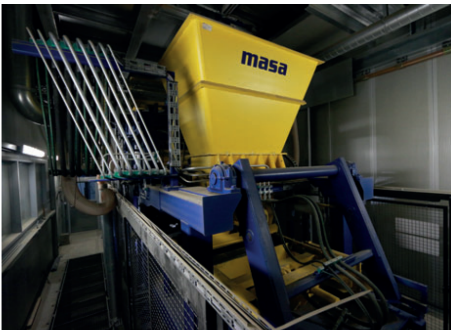
Betonsteinfertigungsmaschine Masa XL 9.1

Doppelwirbler fertigt den Kernbeton für die Pflastersteinproduktion mit Abgabe auf ein Förderband. Der dritte Mischer, ein RIH 0.5 (Nenninhalt 0,5 m 3 ) mit hydraulischem Wirbler, ist für die Produktion des Vorsatzbetons im Einsatz, ebenfalls mit Abgabe auf ein Förderband. Für eine höchstmögliche Flexibilität sind alle drei Ringtellermischer mit einem Vorsilo und separaten Zement- und Wasserwaagen ausgestattet. Für die Farbgestaltung des Betons hat Röckelein eine Dosieranlage für Flüssigfarben von Scholz in den Mischturms integriert.