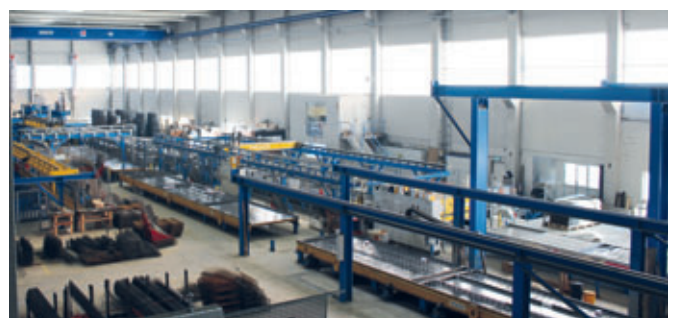
Blick auf die Elementdeckenfertigung, die 2012 in Betrieb genommen wurde