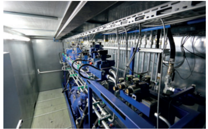
Blick in den Masa Hydraultainer