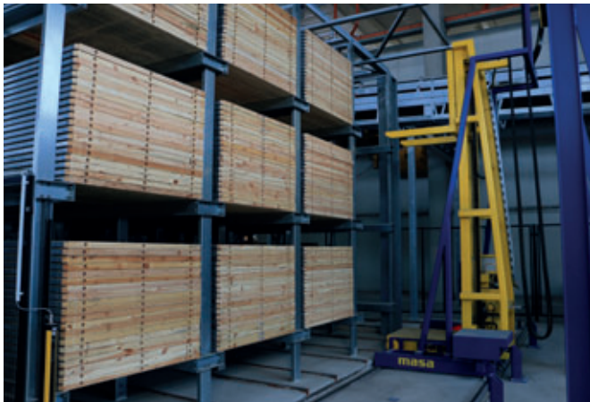
Der Pakettransportwagen nimmt die fertigen Pakete auf und bringt diese automatisch zurück zur Betonsteinmaschine oder setzt den Stapel im Pufferregal ab.