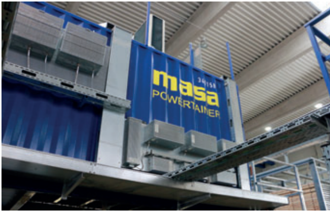
Masa Hydraultainer und Powertainer