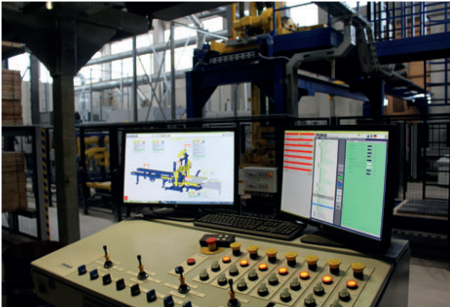
Monitore mit 3D-Visualisierung bieten auch für die Trockenseite den kompletten Überblick.