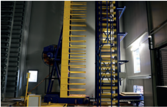
Die Schiebebühne nimmt auf der Frischseite die frisch produzierten Produkte auf