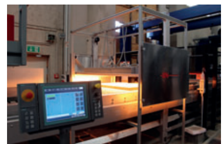
Aushärtung des Schutzlacks unter UV-Licht