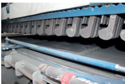
KBH Dancing Weights Alterungsanlage

werden die ausgehärteten Produkte von einem Umsetzer in der kompletten Lage von den Unterlagsplatten gehoben, zur Veredelungslinie transportiert und vor der Multiveredelungsanlage abgesetzt. Mittels Schieber wird dann die komplette Lage in die KBH-Anlage geschoben.